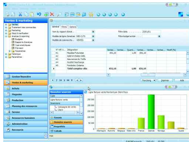
Microsoft Dynamics NAV : l'analyse des ventes